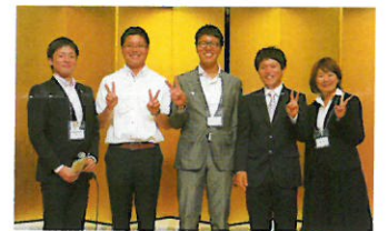
近畿大学体育会洋弓部OB/OG(中国地区)