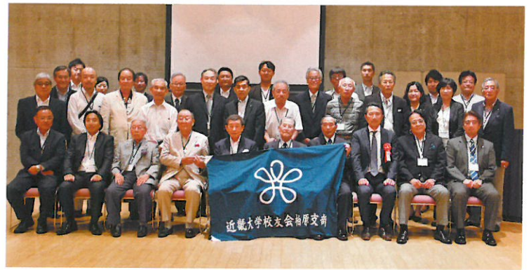
地域支部総会(柏原支部)