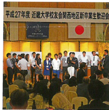
新卒業生歓迎会(関西地区)