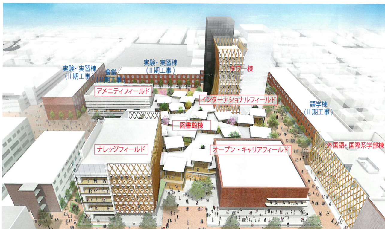
近畿大学東大阪キャンパス整備計画2020年完成イメージ